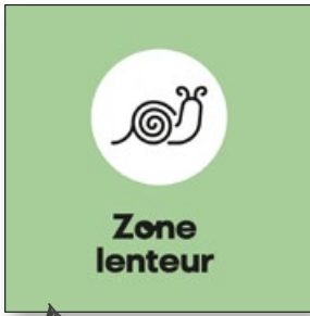
Visuel de la zone lenteur