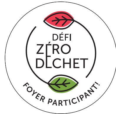
Collant d'identification des foyers participants