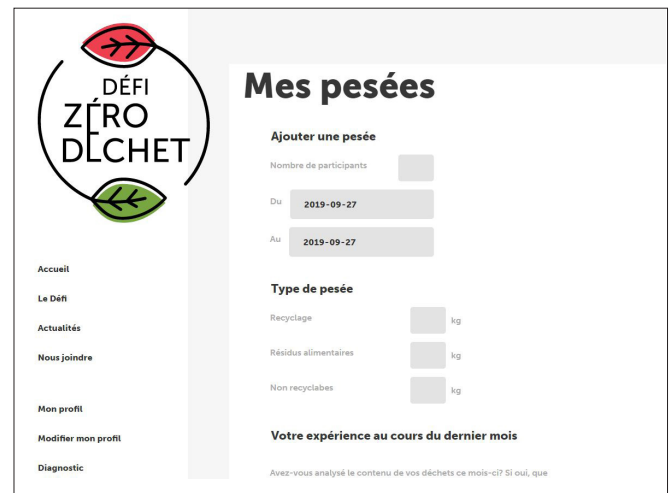
Portail web réservé aux 50 foyers participants pour la pesée de leurs déchets