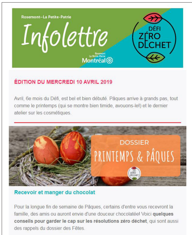
Infolettre destinée aux 50 foyers participants