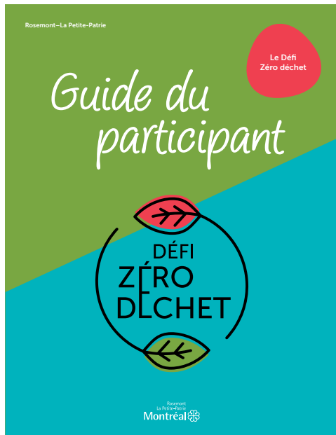
Un Guide du participant a été remis à tous les foyers